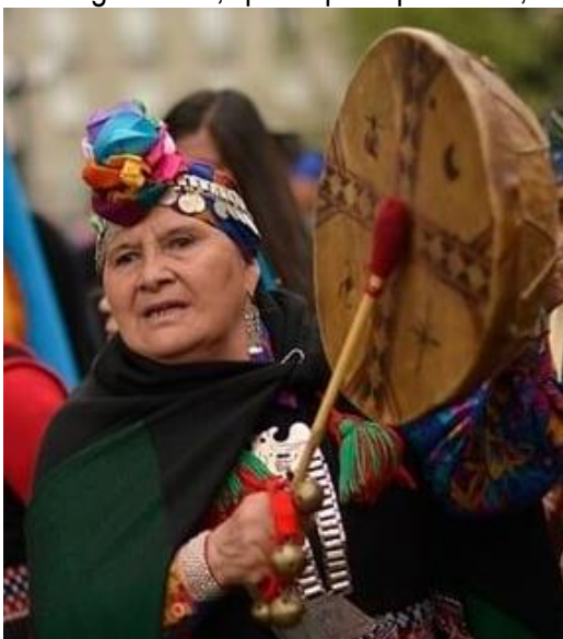
Traje típico - Mapuche

Junto con esto, es importante recordar un poco la historia del pueblo Mapuche que, si bien tienen sus albores en los orígenes del continente, su historia de encuentro con el pueblo chileno data desde finales del siglo XVIII, pero principalmente, será desde el siglo XIX en adelante y, tras una supuesta