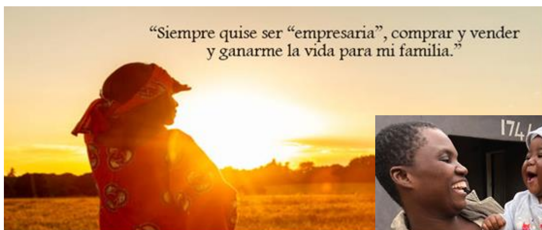
madre refugiada y su hijo