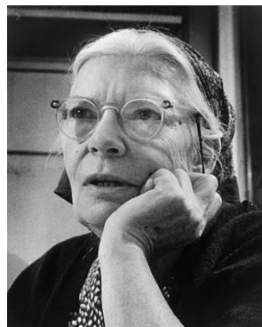
DOROTHY DAY 1897 - 1980