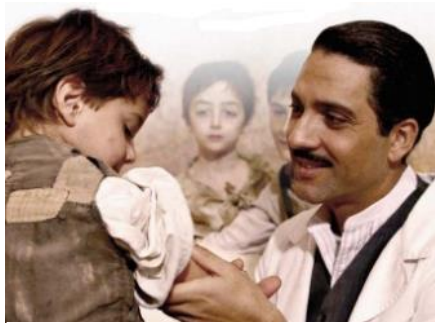
SAINT GIUSEPPE MOSCATI 1880 - 1927

Ninguno de ellos salió de su propia ciudad natal o país. Ninguno de ellos era religioso. Vivieron y trabajaron y se transformaron desde dentro, y a través de su conversión interna transformaron sus ambientes y las personas con quienes compartían la vida. Estaban tan profundamente convencidos de la llamada de Dios en sus vidas que nada más importaba.