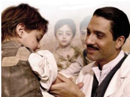
SAINT GIUSEPPE JOSEPH MOSCATI 1880 - 1927

lavorato; si sono lasciati trasformare da dentro. Attraverso la loro conversione interiore hanno trasformato la società del loro tempo e le persone con le quali vivevano. Erano così profondamente convinti della chiamata di Dio nella loro vita che nient'altro contava.