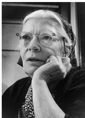
DOROTHY DAY 1897 - 1980