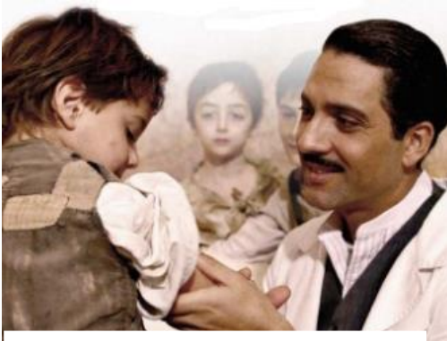
HEILIGER JOSEPH MOSCATI 1880 - 1927

“Liebe die Wahrheit, und wenn es dir Verfolgung bringt, akzeptiere es. Wenn du dein Leben für die Wahrheit opfern must, sei stark in deiner Selbstaufopferung.”