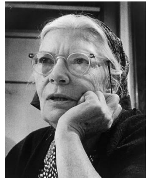
SEL. DOROTHY DAY 1897 - 1980

“Die grösste Herausforderung von heute ist eine Revolution des Herzens, und diese Revolution muss bei jedem von uns selbst anfangen.” Dorothy Day.