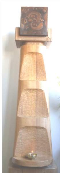
Rehue: Tabernáculo Casa Provincial Temuco

Apreciamos mucho que equipos anteriores de Liderazgo Provincial, durante años, hayan, reflexionado seriamente en este llamado, buscando soluciones. Sus esfuerzos por estabilizar la administración de las Escuelas y un hospital, en el contexto de la disminución del número de Hermanas, son dignos de mención y un modelo para otras Provincias. Las conferencias periódicas de Liderazgo de todos los equipos directivos escolares son una experiencia de fortalecimiento y rejuvenecimiento para ellos y una oportunidad óptima para no salirse del enfoque.