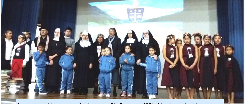
Las cuatro misioneras que fundaron en Río Bueno en 1901- Una dramatización

Muchas hermanas fueron interpeladas a ser “Artesanos de Paz por el llamado del Papa Francisco a la gente de la Región de la Araucanía, durante su visita a Chile, Reflexionamos qué y cómo (podemos) contribuir al proceso de construcción de la nación a pesar de los disturbios prevalecientes. Las hermanas reconocieron que tienen los mejores instrumentos en sus manos: miles de niños y jóvenes y educadores en los colegios, y que hay que buscar las medidas o programas para este fin, (sin hacer política).