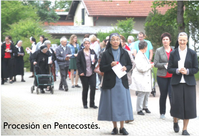
Procesi n en Pentecost s.

Otra caracter stica inspiradora de la Provincia alemana es que la superiora Provincial sigue con la actividad de direcci n espiritual y direcci n de retiros, asumida antes de su elecci n como tal. Un nuevo apostolado que comenz  hace uno o dos a os es la atenci n de los Peregrinos en la Plaza de los Peregrinos en Alt tting, una vez por semana o cuando sea